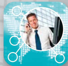
Kết nối kinh doanh