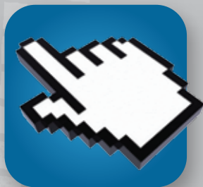
Đăng ký thành viên

Thông qua ISI, người mua nhận được thông tin về nhà cung cấp và nhà cung cấp có thể kết nối với khách hàng toàn cầu bất cứ khi nào và nơi nào, tối đa khả năng hiển thị, giảm thiểu rủi ro và tạo điều kiện thuận lợi thành công trong kinh doanh.