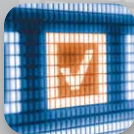
Thẩm định hồ sơ